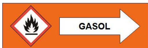
Rörledningsmärkning med faropiktogram