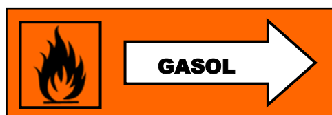
Rörledningsmärkning med farosymbol

Från och med 1 juni 2015 gäller märkningen med faropiktogrammet. Fram till dess kan antingen märkning med faropiktogram eller farosymbol användas.